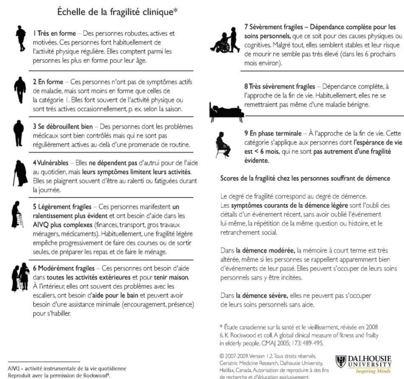
Figure 1. Échelle de la fragilité clinique

A propos des patients hospitalisés en USLD et en EHPAD : les mesures de confinement et d'isolement doivent être appliquées à la règle dans cet environnement de patients fragiles à haut risque d'infection. Par ailleurs, les régulateurs du SAMU doivent avoir un accès facile aux éventuelles directives anticipées et aux notes écrites dans le dossier médical. Ainsi, un médecin d'astreinte doit pouvoir être contacté H24 pour participer le cas échéant à la décision collégiale de non admission en réanimation. Une réflexion sur les modalités optimales d'information des familles doit être entreprise dans un contexte d'interdiction de visites et de possibilité de dégradation brutale.