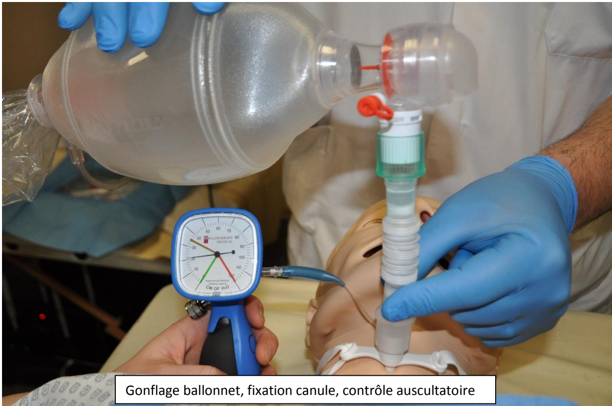
Gonflage ballonnet, fixation canule, contrôle auscultatoire